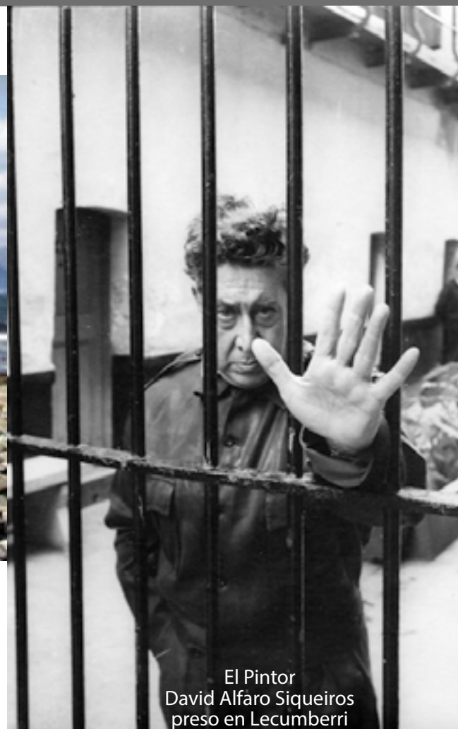
El Pintor David Alfaro Siqueiros preso en Lecumberri

La Colonia Penal Federal Islas Marías fue inaugurada en 1905 por Porfirio Díaz. Tras 113 años en funciones, el expresidente Andrés Manuel López Obrador decretó su cierre para convertirla en el Centro