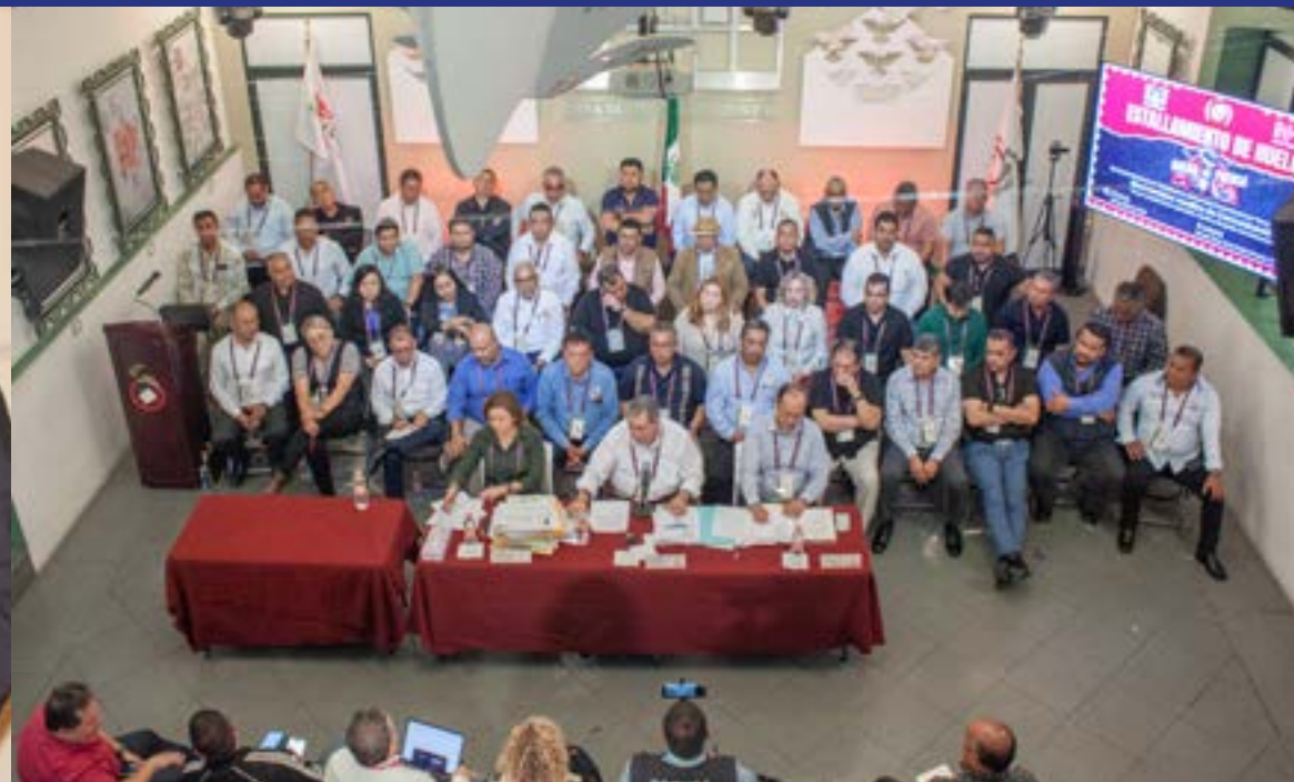
Conferencia de prensa en el Museo Casa de la Cultura Postal