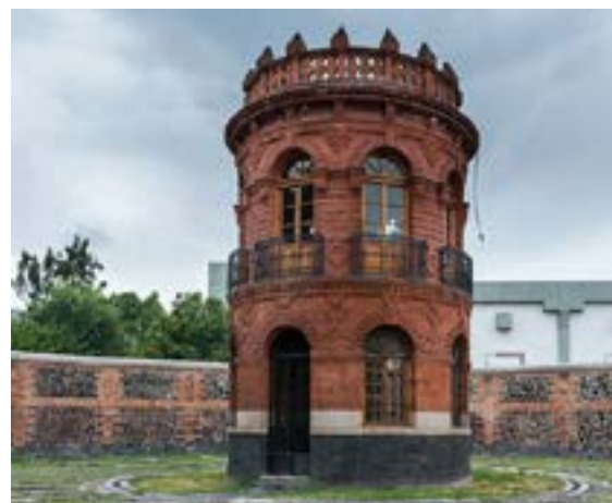
Torre de vigilancia en Lecumberri