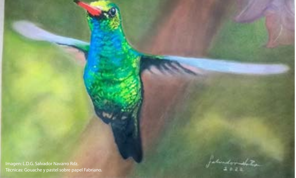
Técnicas: Gouache y pastel sobre papel Fabriano.